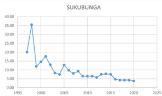
Gambar 2 Grafik Pergerakan suku bunga Bank Indonesia Tahun 1996-2020

Berikut adalah data pergerakan suku bunga di Indonesia periode tahun 1996 – 2020: