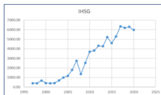
Gambar 1. Grafik Pergerakan IHSG di Bursa Efek Indonesia Tahun 1996-2020 Sumber Data: Bursa Efek Indonesia

Dibawah ini adalah pergerakan indeks harga saham gabungan (IHSG) pada tahun 1996 – 2020: