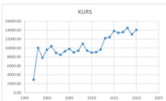
Gambar 3 Grafik Pergerakan kurs Bank Indonesia Tahun 1996-2020

Berikut adalah data pergerakan nilai tukar di Indonesia periode tahun 1996-2020: